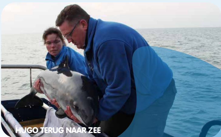
HUGO TERUG NAAR ZEE