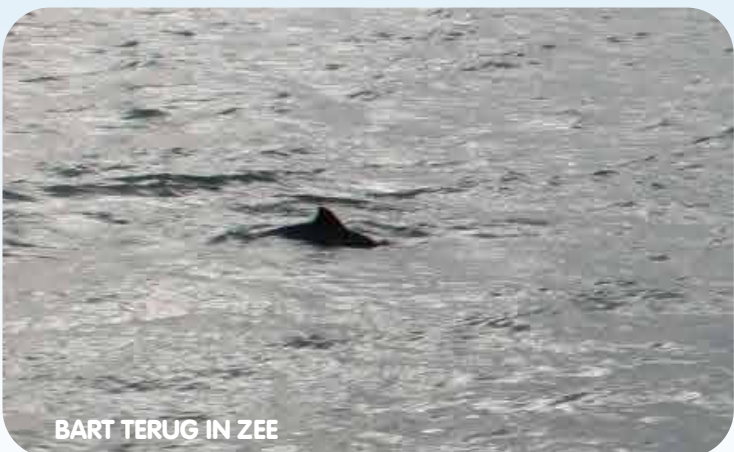
BART TERUG IN ZEE