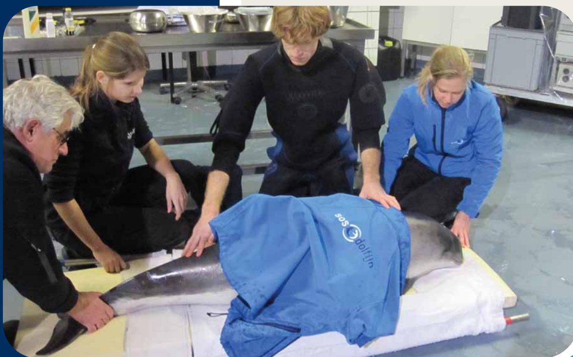
< BINNENKOMST ZWANGERE DESIREE

Bruinvissen Renske en Desiree zijn nog maar relatief kort in de opvang. Zoals op de eerste pagina al staat vermeld zijn beide dieren zwanger en dat vraagt natuurlijk passende zorg. Ook weten we al dat Renske een longworminfectie heeft en oogproblemen. We zullen er alles aan doen om de dieren beter te maken zodat zij en hun jongen in zee verder kunnen leven.