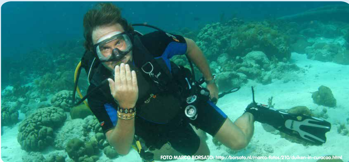
FOTO MARCO BORSATO: http://borsato.nl/marco-fotos/210/duiken-in-curacao.html