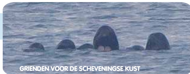
GRIENDEN VOOR DE SCHEVENINGSE KUST

We hoopten natuurlijk dat de dieren hun weg terug zouden vinden naar diepere zee. Helaas kwam er op 2 november een verdrietig bericht uit Frankrijk. In het Noord-Franse Hardelot waren die ochtend tien aangespoelde grienden gevonden. Zes van de dieren waren op dat moment al overleden. De vier levende grienden werden door brandweermannen nat gehouden op het strand. Op beeldmateriaal is te zien dat de dieren vermagerd zijn. Het is zeer aannemelijk dat het om dezelfde groep grienden gaat, die een week eerder voor onze kust te zien was. Er is geprobeerd de vier levende dieren weer terug te brengen naar zee. Eén van de dieren is helaas alsnog op het strand overleden. De andere drie dieren verkeerden in zorgelijke toestand, maar zijn door de brandweer wel teruggezet in zee. SOS Dolfijn hoopt dat de grienden het gered hebben.