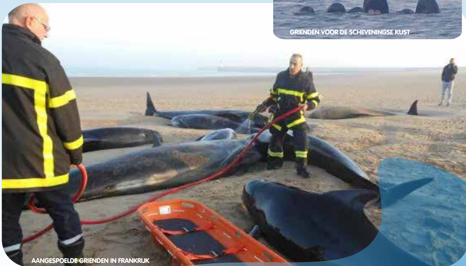
AANGESPOELDE GRIENDEN IN FRANKRIJK