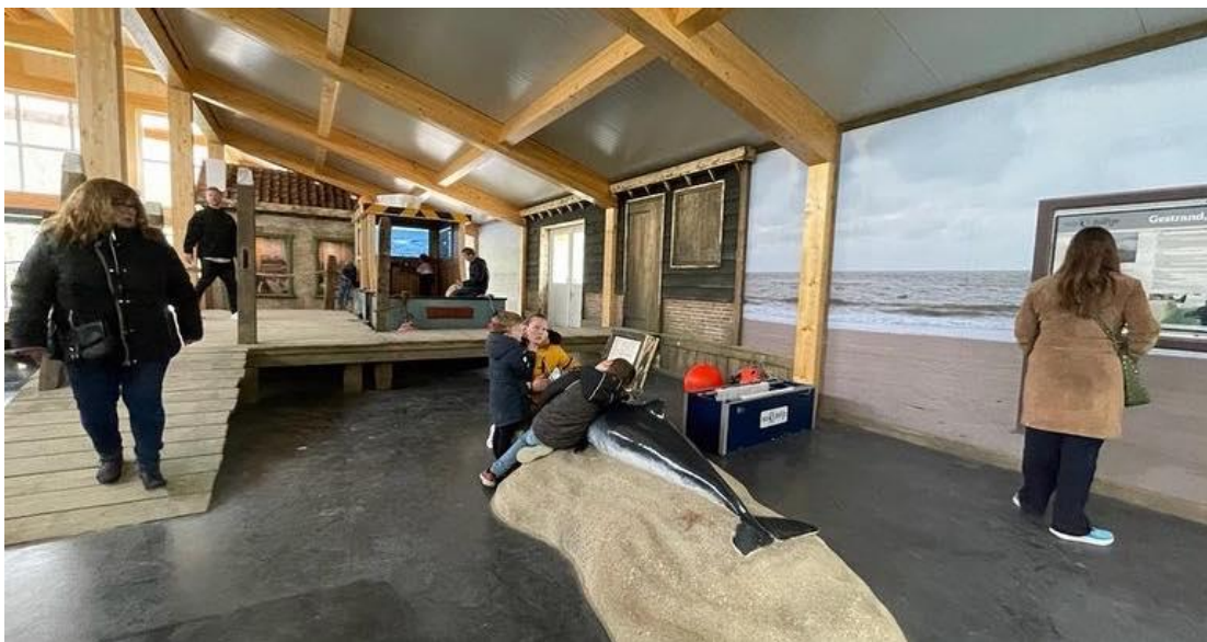
Deel educatieruimte in Anna Paulowna