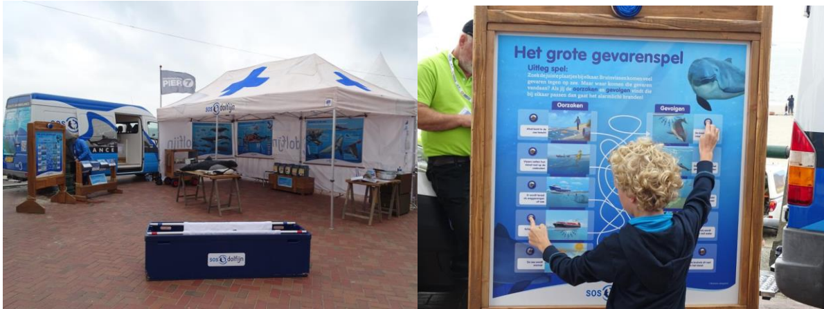
Het Reizende Walvisziekenhuis van SOS Dolfijn en interactief spel

Meer informatie over de educatieve platforms van SOS Dolfijn lees je hier: