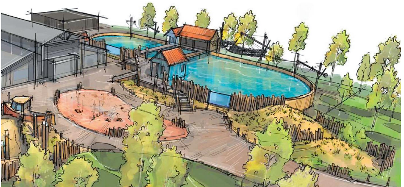
Ontwerp uitbreidingsplannen rondom het educatief opvangcentrum

Onderliggend plan geeft weer waar SOS Dolfijn de komende jaren heen wil en hoe het daar wil komen. Jaarlijks zal een activiteitenplan worden opgesteld met een jaarplanning en daaraan gekoppelde budgettering. Na afloop van elk jaar wordt de jaarrekening openbaar gemaakt op de website van de stichting, alsook een jaaroverzicht van de operationele activiteiten.