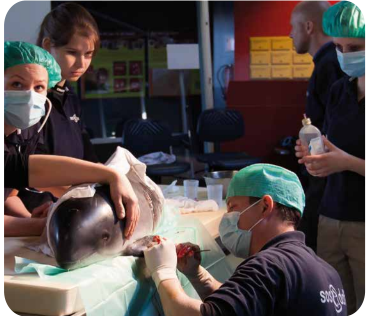
OPERATIE BRUINVIS BIJ SOS DOLFIJN

Het zwemgedrag van Sjors ziet er, ondanks twee verkorte vinnen, niet anders uit dan bij andere bruinvissen. Sjors is momenteel nog niet helemaal gezond. We hopen dat hij snel helemaal hersteld zodat we hem terug kunnen brengen naar zee. Hij moet dan wel aan alle uitzetcriteria voldoen.